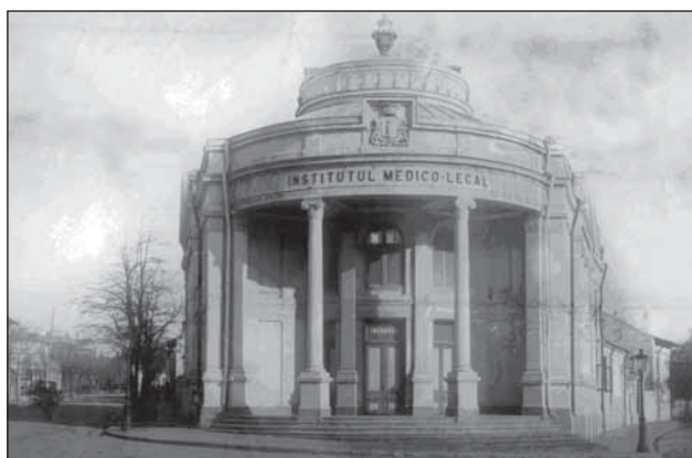
Morga Bucureștilor pe la sfârșitul secolului al XIX-lea

vreun accident. Birjarii bucureșteni mai prezintă, și din alte puncte de vedere, un interes medico-legal. Clasa cea mai proeminentă a acestora o formează «scopiții», care sunt o sectă rusească emigrantă, și ale căror practici religioase constau în castrare. Aceasta este însă efectuată după ce bărbații se căsătoresc și capătă un fiu, astfel ca continuitatea familiei să fie posibilă. Fizionomia feminină a acestor castrați stând pe capra [trăsuri] este într-adevăr surprinzătoare. Accidente operatorii nu par să se fi născut, drept [pentru] care guvernul român nu găsit nici o ocazie, până în prezent, ca să interzică aceste moravuri de automutilare, chiar dacă aici este vorba de un „secret“ cunoscut de toți.