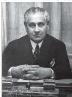
Nicolae Minovici (1868-1941)

În februarie 1932, Mina Minovici devine membru corespondent al Academiei de Medicină a Franței. Cu această ocazie, guvernul francez i-a decernat «Legiunea de onoare» în grad de cavaler. A rămas director pe viață al Institutului Medico-Legal, în baza unei legi speciale pentru el, adoptată de corpurile legiuitoare în anul 1930.