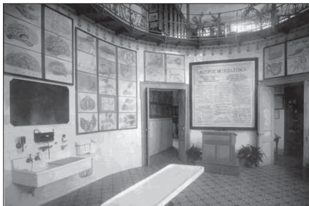
Sala de autopsie a morgii, cu planșele didactice (fotografie cca. 1900)

într-adevăr guvernul român nu a precupețit [cu] mijloacele [materiale]. Fondul real al morgii se ridică la 12.000 franci, la care se mai adaugă un ajutor bănesc de aproape 2.000 de franci din fondurile Universității.