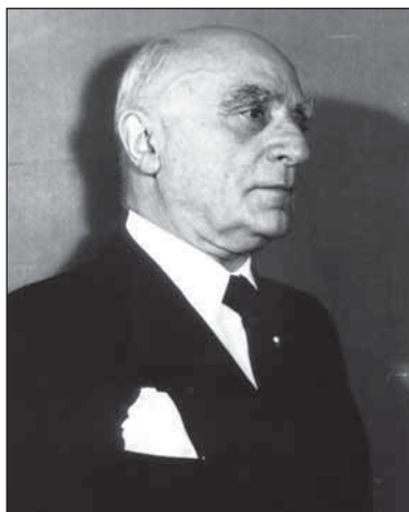
Jean Lhermitte (1877-1959)