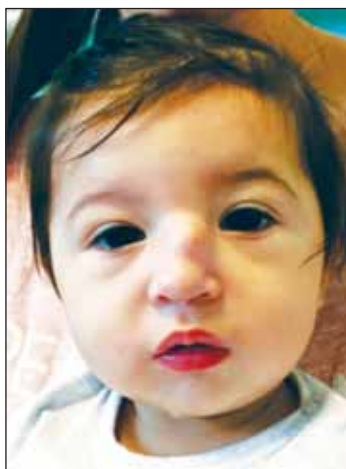
FIGURA 4. Gliom nazal preoperator

mensionale în raport cu mișcările respiratorii sau efortul de plâns.