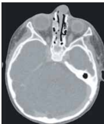
FIGURA 5. Aspect CT preoperator al gliomului

Imagistica a relevat prezența unei formațiuni slab vascularizate, fără limite clare. În unele incidente, posibilitatea unei formațiuni chistice putea fi luată în considerație (vezi Fig. 5), lucru neconfirmat clinic palpator.