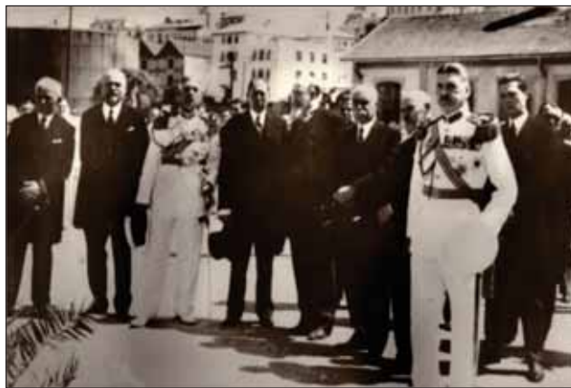
FIGURA 11. Constantin Angelescu alături de Nicolae Iorga și alți politicieni ai vremii

În timpul Marelui Război, la cererea lui Brătianu, a organizat Serviciul Sanitar al armatei. A înființat ateliere de pansamente și comprimate, unde munceau sute de lucrătoare, iar în toamna anului 1916 a organizat 600 de vagoane de material sanitar, a menținut spitalele, în general a avut o activitate apreciată ca „demnă de toată lauda“.