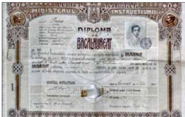
FIGURA 13. Diplomă bacalaureat 1925

A înființat un număr de 14.000 de biblioteci școlare cu cărări de la Casa Școalelor (1). A definitivat proiectul societal românesc în perimetrul rezervat educației și culturii. A formulat în 29 martie 1923 textul constituțional cu privire la învățământ: libertatea învățământului, obligativitatea și gratuitatea învățământului primar.