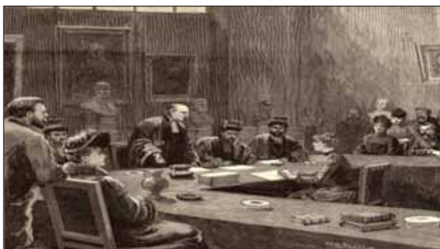
FIGURA 4. Susținerea de teze de doctorat în medicină la Paris, desen de Paul Desteș