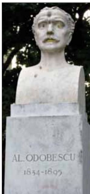
FIGURA 17. Bustul lui Al. Odobescu

C. Angelescu dorea ca școala românească să aibă caracter informator, să aibă corp didactic de toate gradele și să „arunce” în viață și economie specialiști de toate gradele, iar conducerea în învățământ să fie, așa cum spunea domnia sa, „după o direcțiune unică a ministerului pentru plămădirea prin cultură a unității naționale”.