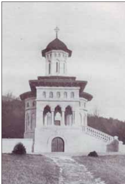
FIGURA 9. Biserica de la Florica

Moartea însă l-a scutit de arestarea și trimiterea în închisorile comuniste. Rămășițele sale se află în cavoul unui binevoitor prieten politic (7,13).