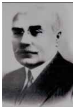
FIGURA 12. Constantin Angelescu, prim-ministru al României 29 decembrie 1933 – 3 ianuarie 1934

Activitatea lui C. Angelescu este de mare amploare în educația și cultura societății românești pentru pătrunderea filozofiei progresului în România, pentru a fi la nivel european.