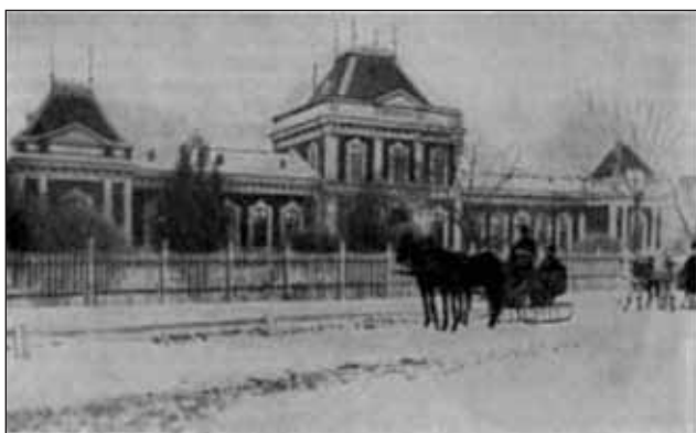
FIGURA 6. 1853: „Școala de mică chirurgie“ de la spitalul Filantropia

Grigore Monteoru era „milionarul cu o intuiție genială în afaceri“ (19).