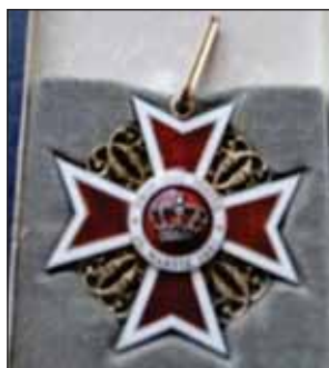
FIGURA 20. Ordinul Coroana României în grad de Comandor 1916