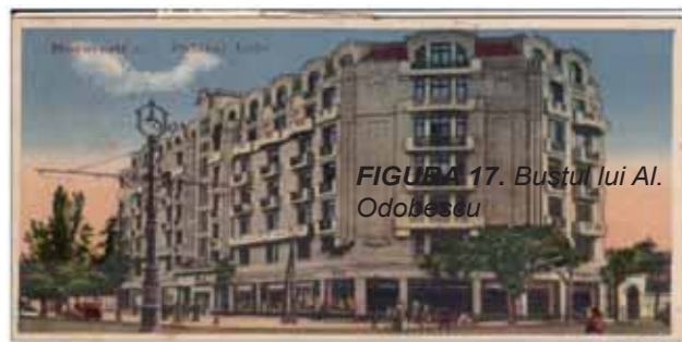
FIGURA 15. Hotelul Lido

La Ateneul Român, pe care l-a condus un număr mare de ani, a construit săli studio, săli cu expoziții artistice, biblioteca Ateneului, notăm și „Marea frescă a istoriei neamului nostru“ de la Ateneu, pictată de pictorul Petrescu și dezvelită la 23 mai 1938.