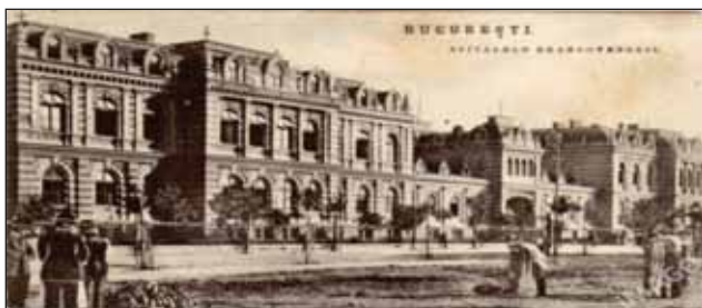
FIGURA 5. Spitalul Brâncovenesc 1900