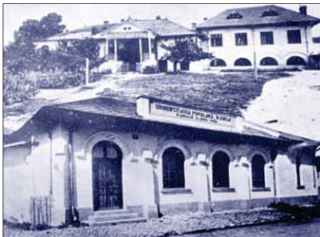
Figura 19. Universitatea Populară „N. Iorga” Vălenii de Munte

nistru plenipotențiar al românilor în SUA 1917-1918 (primul nostru ambasador în America); a înființat Comitetele școlare și s-au construit 12.000 localuri de școală între anii 1922 și 1938; președinte al Ateneului Român 1923-1947, timp de 24 de ani; președinte al Academiei de Medicină 1935-1948; membru de onoare al Academiei Române (1934-1948); membru fondator al Academiei de Științe România; membru al Consiliului Sanitar de Medicină de la Paris; membru al Societății Internaționale de Medicină din Paris și Bruxelles.