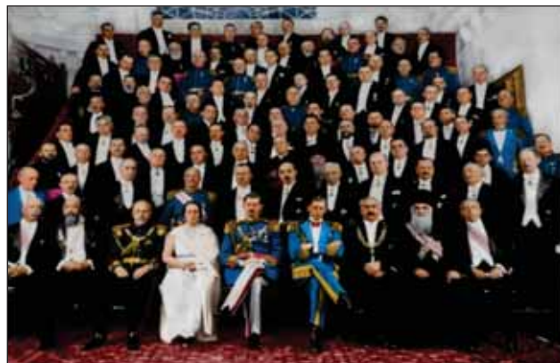
FIGURA 10. Constantin Angelescu alături de elita politicii românești

Activitatea politică a lui C. Angelescu se poate analiza pe două planuri: a) planul politicii interne (deputat 1901, președinte al organizației Partidului Național Liberal din Buzău, senator, Ministru al Instrucțiunii și Lucrărilor Publice); b) planul politicii externe (ministru polipotențiar la Washington, membru în Consiliul Național Pentru Unitatea Românilor).