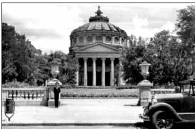
FIGURA 16. Ateneul Român

C. Angelescu a înființat „Misiunea istorică la Viena”: cercetări de arhivă din Austria.