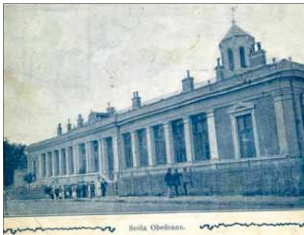
FIGURA 2. Școala Primară „Obedeanu”, Craiova

chirurg la Spitalul Brâncovenesc și apoi la Filantropia. Devine „operator abil și cercetător”, așa cum notează C.