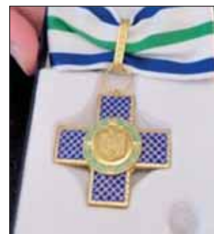
FIGURA 21. Ordinul Meritul Cultural de Comandor 1916