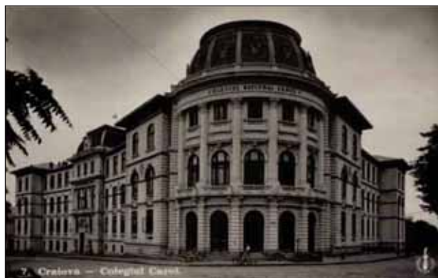
FIGURA 3. Colegiul „Carol I”, Craiova

A fost membru activ al Societății Naționale de Chirurgie din Paris din 1927, al Societății Internaționale de Chirurgie de la Bruxelles din 1929 și al Societății Internaționale Chirurgicale din Paris din anul 1930.