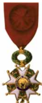
FIGURA 22. Ordinul Crucea Legiunii de Onoare