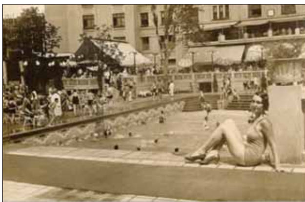
FIGURA 14. Piscina Lido

A fost colecționar de tablouri, opere de artă și antichități.