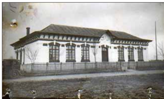
FIGURA 18. Școala din județul Gorj 1940

A construit aproape toate școlile României interbelice („doctorul cărămidă”).