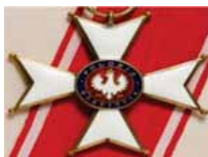
FIGURA 23. Ordinul Polonia Restituită