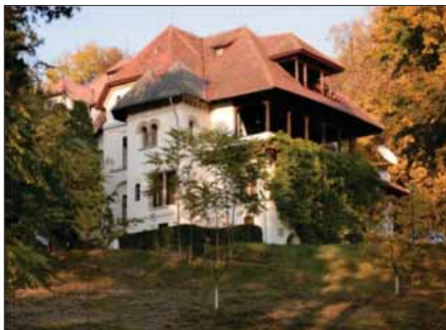
FIGURA 8. Conacul Brătianu de la Florica

Înainte de a discuta despre Constantin Angelescu și monumentală sa activitate culturală, subliniem și faptul că în Liga Culturală, de-a lungul istoriei, am avut mari oameni de cultură, iar realizările lui C. Angelescu au fost trecute „sub semnul tăcerii“ în perioada comunistă.