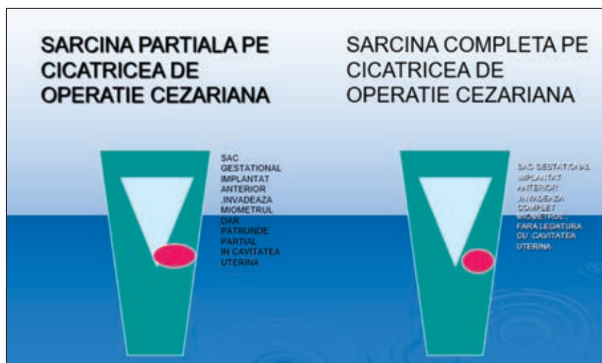
FIGURA 1. Tipurile de sarcină ectopică pe cicatricea de operație cezariană

Așa cum se poate observa în Figura 1, sarcina pe cicatrice poate fi parțială – când există o legătură cu cavitatea uterină și sarcina completă pe cicatricea de operație cezariană, când nu există nici un fel de comunicare cu cavitatea uterină.